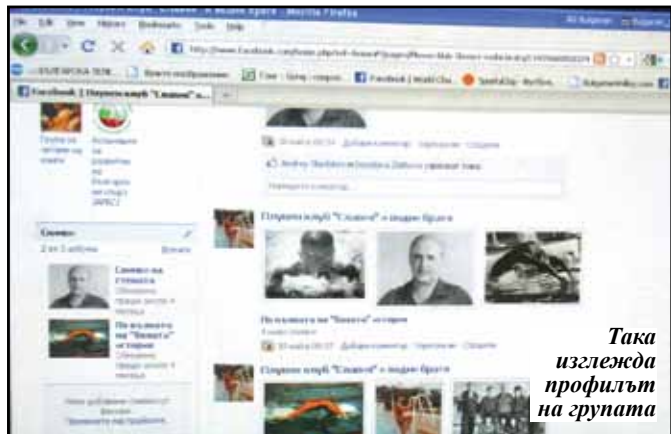
Така изглежда профилът на групата

Впечатляващ е и фотоархивът. Част от снимките оставиха поразени и самите състезатели, неподозиращи за съществуването на подобни кадри. С голяма историческа стойност е общата снимка на състезателките и треньорите, извоювали отборната републиканска титла на 25-метров басейн през