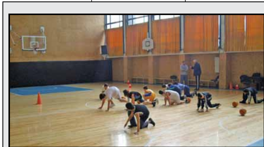
С ремонтирана зала посрещнаха новия сезон младите баскетболистки на „Славия“. На съоръжението на стадиона в квартал „Овча купел“ бе подновена настилката, като сегашният паркет е от най-висока класа. Освен това бяха сменени с нови десетилетните кошове, както и бе подменена облицовката на стените. С новите великолепни условия да се тренира баскетбол в „белия“ клуб вече е истинско удоволствие.

V кръг – 13 ноември „Берое 07“ – „Славия“, зала „Общинска“ – 18.00 часа