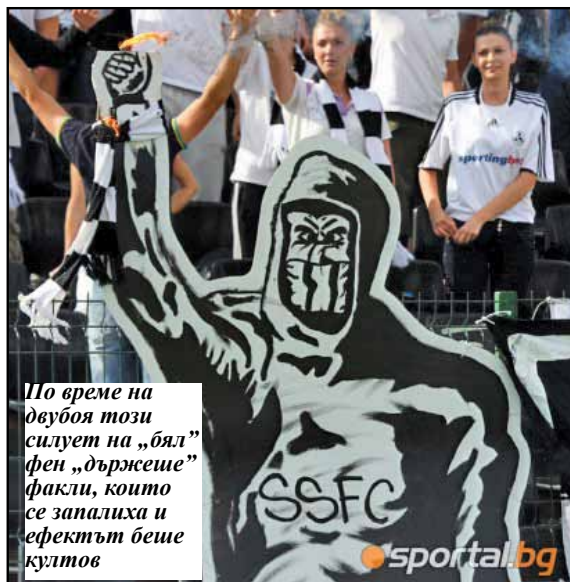
По време на двубоя този силует на „бял“ фен „държеше“ факли, които се запалиха и ефектът беше култов

Беше подготвена хореография със знамена – 20 черни и 20 бели, както и дръзката идея