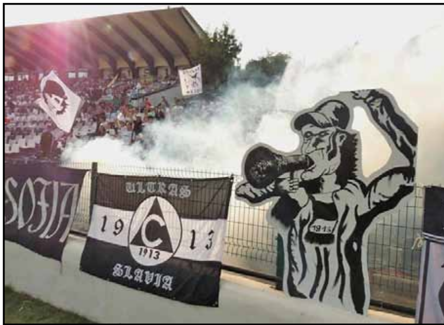
Част от колоритната хореография на улtrasите включваше фигурките от картон, както и пироефекти

лични места. Така, групата, която се събра за двубоя с „червените“ след единственото попадение, набъбна значително. Всички в славистката торсида пееха безрезервно и до край, което бе чудесно.